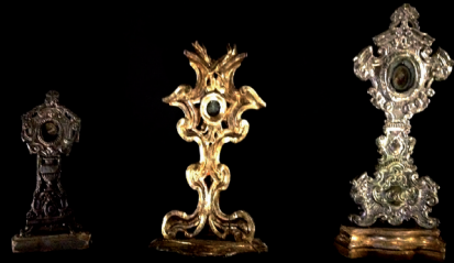
Relicarios del S. XVIII con trozos de la Sábana Santa, sellados por el Papa Clemente XII (1730-1740) y Benedicto XIV (1740-1758).

Pero es la formación de la misma, a la que el hombre del S. XXI sigue sin dar respuesta.